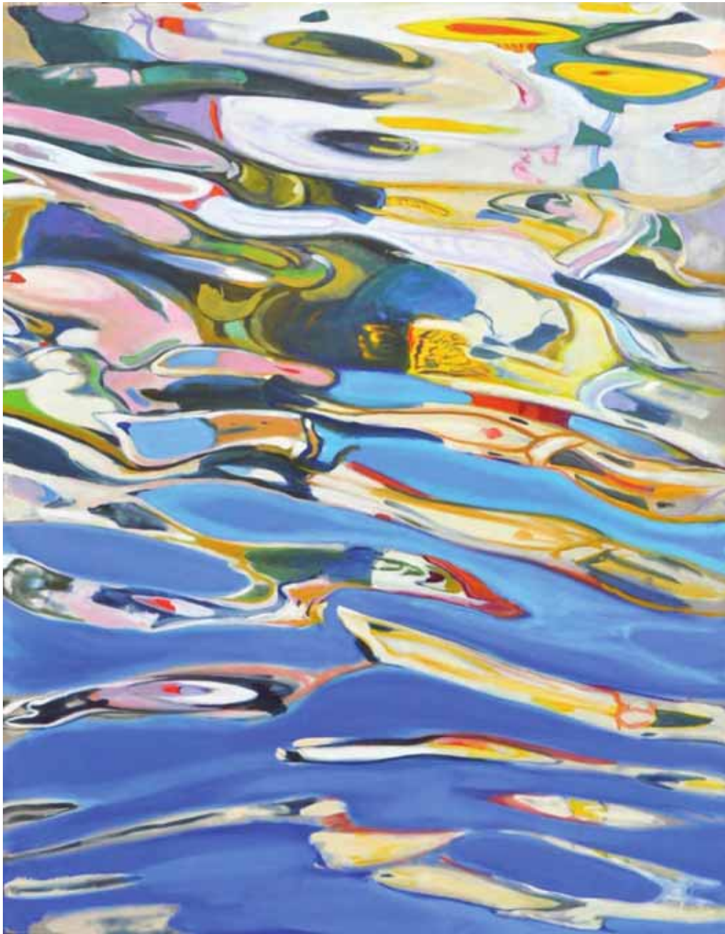
Le jeu de la lumière sur l'eau et son influence sur les couleurs occupent une place prépondérante dans l'oeuvre de Kevin Pearsh. This play of light and colours on the surface of water is a main ingredient of Kevin Pearsh's art.

l'eau, peint par Kevin Pearsh, n'a pas de frontière. A l'image de ce petit garçon, assis sur un muret et contemplant le Gange, on se surprend à se perdre dans les reflets de ces toiles et à y recréer les paysages, les hommes et les femmes, les ciels et les soleils irréels qui dansent à la surface de ces lacs, rivières et océans. A l'image de la large toile (140 x 300 cm) qui sert de pivot central à Ganga 21, on pourra tout aussi bien y retrouver les teintes ocre des saris ou les couleurs vives des barques des pêcheurs que les reflets d'un monde intime. Largement saluée par la presse et par le public, l'œuvre de Kevin Pearsh est une fenêtre onirique sur un monde que chacun découvre avec sa sensibilité propre. Pour y accéder, il faudra cependant s'armer de patience. Plébiscité en Inde, l'exposition Ganga 21 ne devrait pas être présentée en Europe avant plusieurs années. Et les quelques rares œuvres disponibles à la vente ne sont visibles que dans un seul lieu en Europe, la galerie d'art contemporain « Number 9 » à Birmingham, en Angleterre.