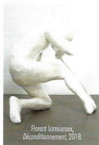
Florent Lamouroux, Déconditionnement , 2018.

aux clichés par des réalisations qui mettent en scène des enveloppes corporelles clonées, des secondes peaux de plastique, des vêtements et revêtements porteurs de signes reconnaissables du premier coup par nos yeux de consommateurs imprégnés de codes sociétaux. Dans cette exposition, l'artiste prolonge ce traitement de la surface des corps à l'égard du paysage et de la nature. Inspiré par le contexte des bords de Seine chers aux impressionnistes, Florent Lamouroux propose un corpus d'œuvres récentes qui dialoguent entre elles pour mieux interroger la notion de paysage comme un corps dont la surface évolue et change au fil du temps. Un regard singulier sur notre environnement et la manière dont nous le percevons et l'habitons.